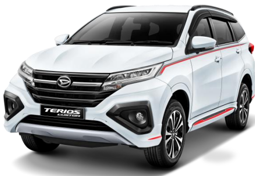
テリオス カスタム