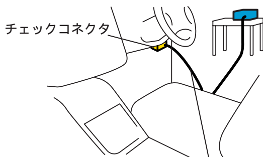
一括作動処理ツールのケーブル